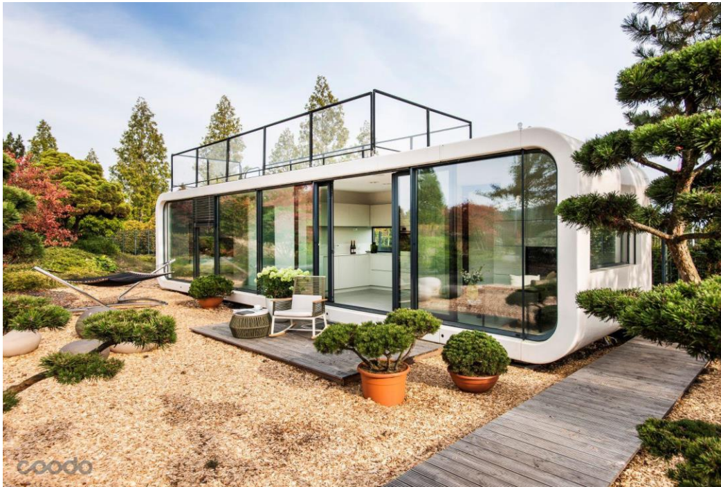
Bild 1: Sensorberg stattet die „coodos“ von LTG mit Smart-Living-Technologie aus.